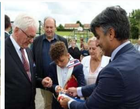
La plateforme de sports et loisirs a été baptisée « Le Parency ». C'est le nom qui a été retenu après consultation de la population.