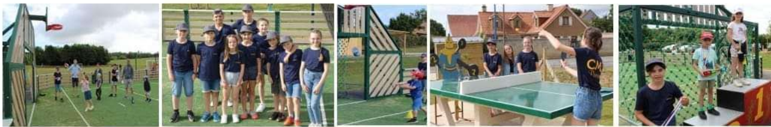
En matinée, à l'initiative de Conseil municipal junior, la jeunesse parentoise était invitée à participer à des tournois sportifs.